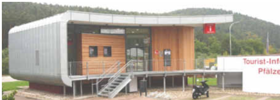
Modern und aus Holz: Der Rundbau beherbergt das Tourist-Info-Zentrum Pfälzerwald.