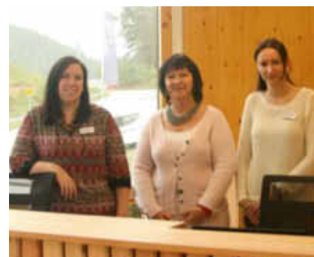
Das Team des Tourist-Info-Zentrums Pfälzerwald.