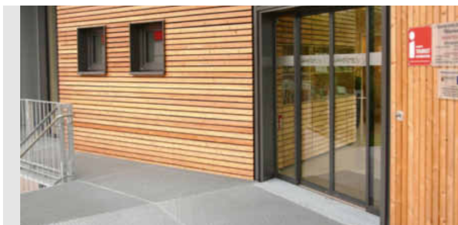
Quer und längs: Innen und außen sind die Wände mit Holz verlegt.

die Verbandsgemeinde war es ein zukunftsorientierter Schritt, dieses innovative Gebäude als Zeichen zu bauen. Durch den Energiegewinn aus der Solaranlage kann das Gebäude als Null-Energie-Haus betrieben werden. Geld dazugetan haben übrigens die EU, das Land Rheinland-Pfalz und auch der Kreis. „Mich persönlich inspiriert die Anordnung der Holzpaneelen“, sagt Spieß. Links vom Eingang verlaufen sie von außen nach innen quer, rechts senkrecht. Letztlich zählt bei den Gästen jedoch der Gesamteindruck von der Region. Und der ist wichtig. „Ein zufriedener Gast ist ein Multiplikator und sorgt für drei neue Gäste in der Region“, weiß die Expertin.