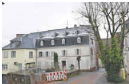
Neues Leben im alten Gasthaus Freudenburg: Im Rahmen des Wettbewerbs ...

Kil: Wenn eine Gemeinde ein Ziel vor Augen hat, dann kann man mit Leergut was verändern. Wo alles an seinem richtigen Platz ist, herrscht auch eine unglaubliche Trägheit. Wenn Menschen in der Gemeinde eine Idee haben und dann – zum Glück – auch ein paar leere Flächen, die sie dafür nutzen können, dann ist nicht jeder Leerstand sofort eine Plage. Dann kann das auch ein Türöffner zu etwas Neuem sein. Aber man muss eine Idee haben, die braucht es vorher.