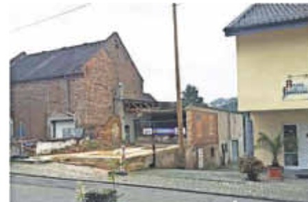
Manchmal hilft nur noch Abriss: Leerstand bietet Chancen für Neues.