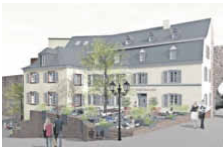
... „Mehr MITTE bitte!“ entstand ein neuer Entwurf (Müllers Büro, Vollmersweiler).