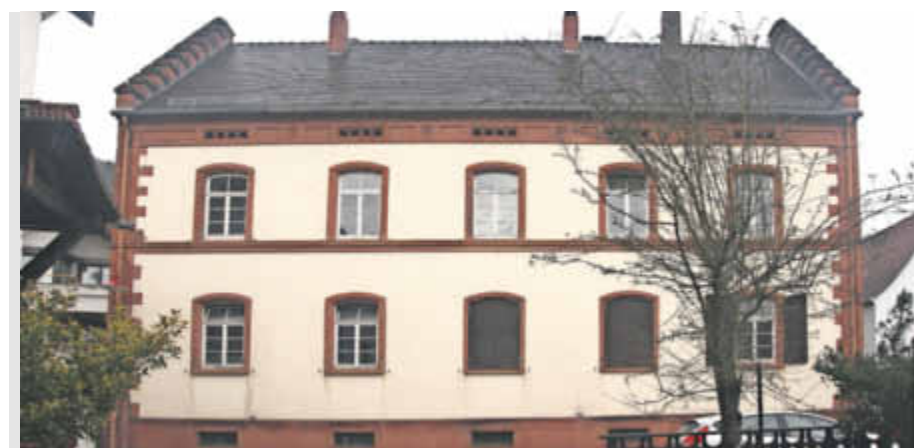
Das Hoffmannsche Haus in Wilgartswiesen von der Straßenseite aus gesehen.

sagt Weber. Unten befand sich die Gaststätte. „Flößer, die auf der Queich unterwegs waren, kehrten hier ein. Die alte Postkutschstation war nicht weit entfernt und sorgte sicherlich auch für Gäste“, berichtet Weber. Die Postkutsche fährt zwar schon lange nicht mehr, doch für Urlauber ist die Region in der Südwestpfalz heutzutage immer noch überaus attraktiv – ob zum Wandern oder Radfahren oder für die kulinarischen Genüsse. Das Haus mit Geschichte ist Teil des Ortes und seiner Historie. Nun braucht es wieder eine Zukunft.