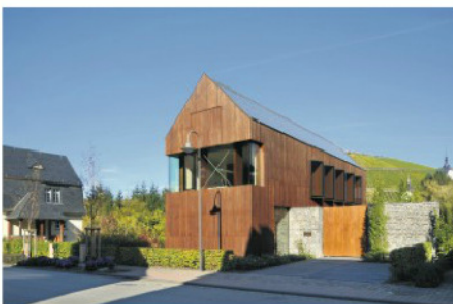
Regionaltypisches Material modern interpretiert (Architekten Stein Hemmes Wirtz)

Röttgen: Die typischen Materialien sind ja oft vor Ort vorhanden, wie Naturstein oder Holz, oder es sind heimische Pflanzen, die als Hecken gepflanzt werden können. Das dient auch dem Artenschutz. Bei uns gibt es viel regionale Steinbrüche, wenn man gezielt sucht, ist es möglich regionale Steine zu bekommen oder über örtliche Baumschulen heimische Pflanzen. Und wenn man in Holzmärkten ein bisschen hartnäckig nachfragt, bekommt man statt der üblichen sibirischen auch die europäische Lärche.