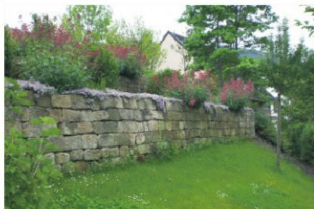
Trockenmauer aus Sandstein (hofmann_röttgen LANDSCHAFTSARCHITEKTEN BDLA)