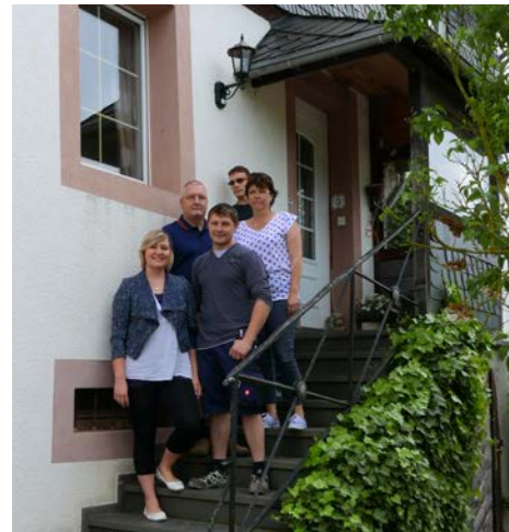
Jung und alt: Die Familie hält zusammen.