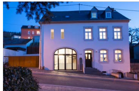
Im Raum Trier gehören Gauben dazu: Haus mit Scheune, Mertendorf (CJS Architecte).