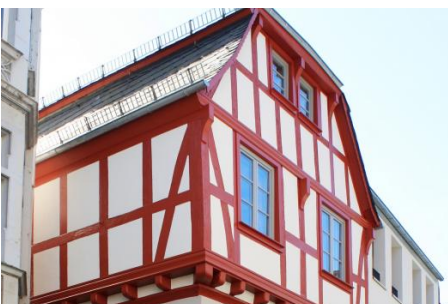
Das Stadtcafé in Bacharach: Das Fachwerkhaus aus dem 17. Jahrhundert wird neu ...