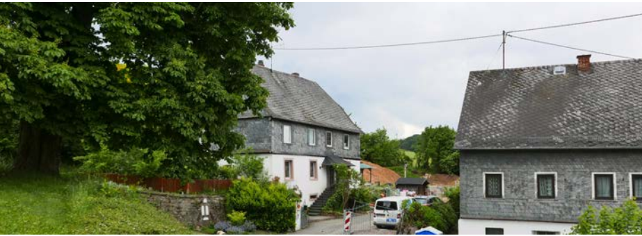
Das Pfarrhaus von Schnorbach (links), rechts dahinter entsteht zur Zeit der Neubau.