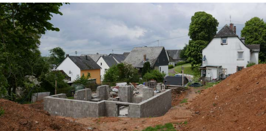
Der Neubau in Arbeit: Am Ende kommt es auf Fassadenstruktur und Farbgebung an.