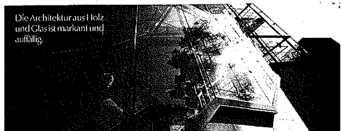
Die Architektur aus Holz und Glas ist markant und auffällig.

Quellwasser kühlt. „Das energetische Konzept des Gebäudes ist voll aufgegangen“, freut sich Diehl. Die Kosten für den Wärmebedarf konnten massiv gedrückt werden. Dass das Haus die Wärme nicht nach außen abgibt, hat in den warmen Sommermonaten allerdings für Probleme gesorgt. „Wir mussten nachträglich die Belüftung erneuern“, berichtet Diehl. „Die ursprüngliche Umluftbelüftung hat im Sommer bei 30 Grad Celsius warme Luft in Haus gebracht.“ Die nachträglich eingebaute Anlage nutzt Quellwasser, um die einströmende Luft zu kühlen. So herrscht nun auch im Sommer ein angenehmes Raumklima. Zufrieden ist Diehl mit den gut gegliederten Funktionsbereichen, der Orientierung für die Besucher. Zuständig für den Entwurf waren die Architekten Stephan Böhm und Maria Mocanu aus Köln. Und das Wichtigste: Die Kinder, die täglich das Biosphärenhaus erobern und hier die Natur entdecken, sind begeistert.