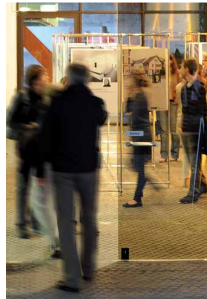
Gestaltung: Agentur 42